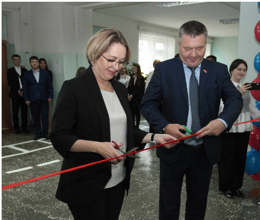
Торжественное открытие Центра «Точка роста» в МБОУ «СОШ п.Синегорье»

На торжественное открытие нашего Центра с поздравлениями приехали гос-