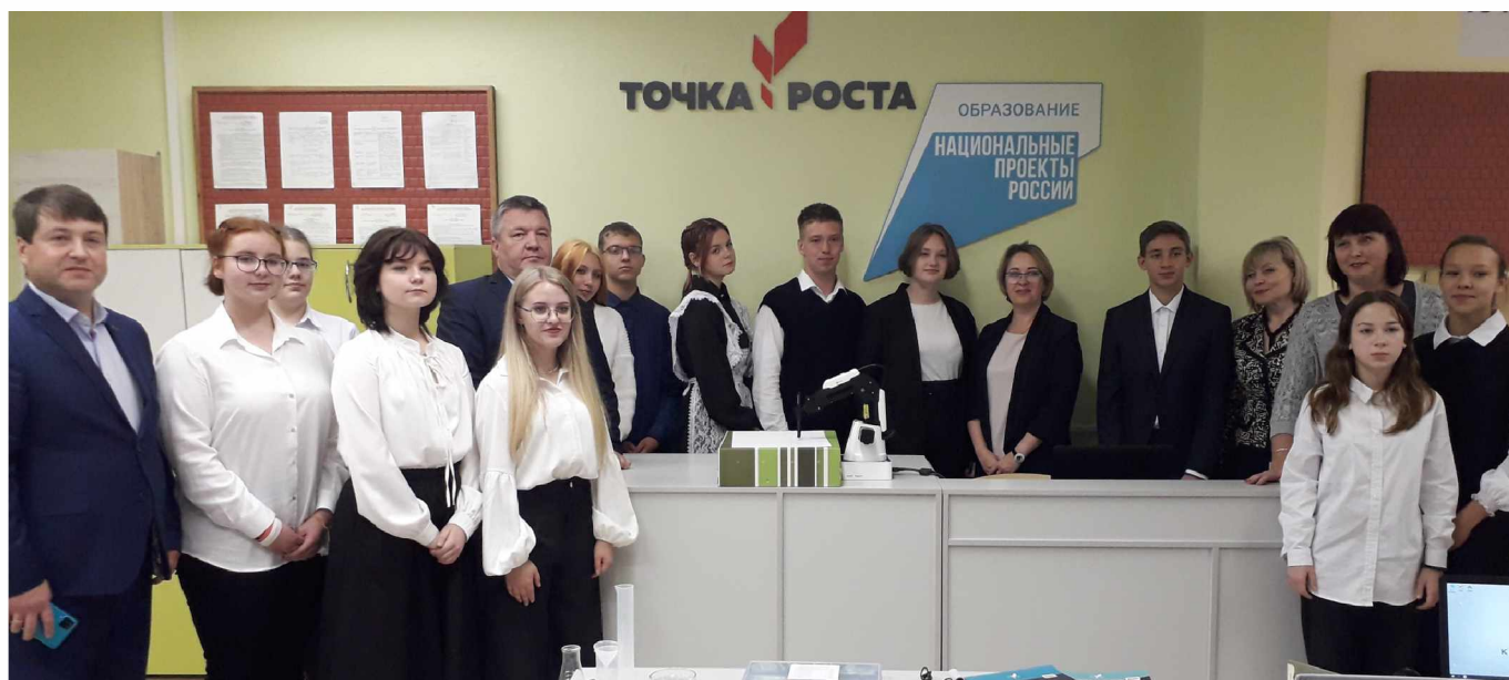
Презентации лаборатории биологии