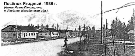
Посёлок Ягодный. 1936 г.