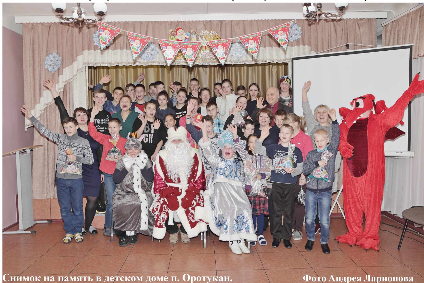
Снимок на память в детском доме п. Оротукан.