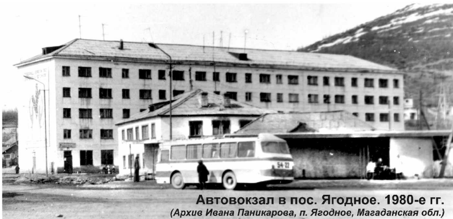
Автовокзал в пос. Ягодное. 1980-е гг.