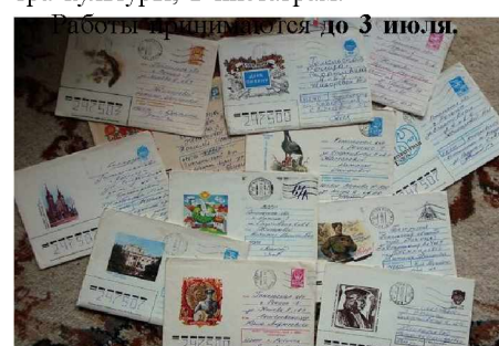
Работы принимаются до 3 июля.

Лучшие работы будут опубликованы в газете «Северная правда», на сайте Центра культуры, в инстаграм.