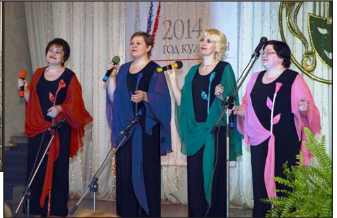
(Окончание. Начало на 3-й стр.)

Затем зрителям была предложена концертная программа, которая состояла из самых лучших номеров художественной самодеятельности. Выступления каждого исполнителя, каждого