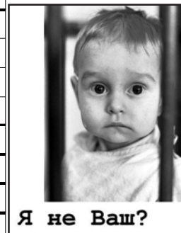
Я не Ваш?

Полную информацию о детях вы сможете получить по адресу: п. Ягодное, ул. Школьная, 9, отдел опеки и попечительства. Телефон 2-24-57.