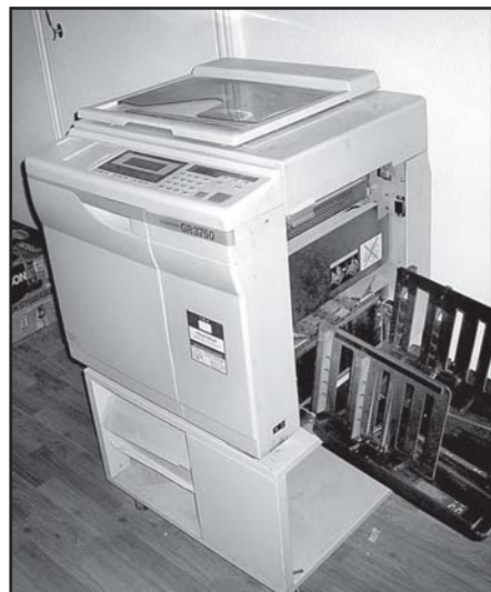
Ризограф - сегодня на нем мы печатаем газету.

(Продолжение. Начало на 3, 6-й стр.) развитию золотодобычи в районе, уделяла серьёзное внимание строительству Колымской и Усть-Среднеканской ГЭС. Более подробно об этом писать, думаю, не стоит, так как в новейшее время произо-