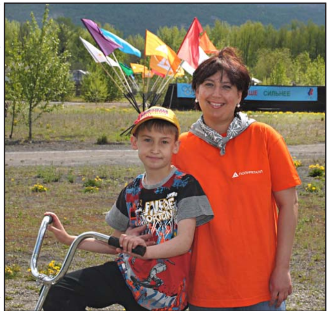
Мы на стадионе в День металлурга