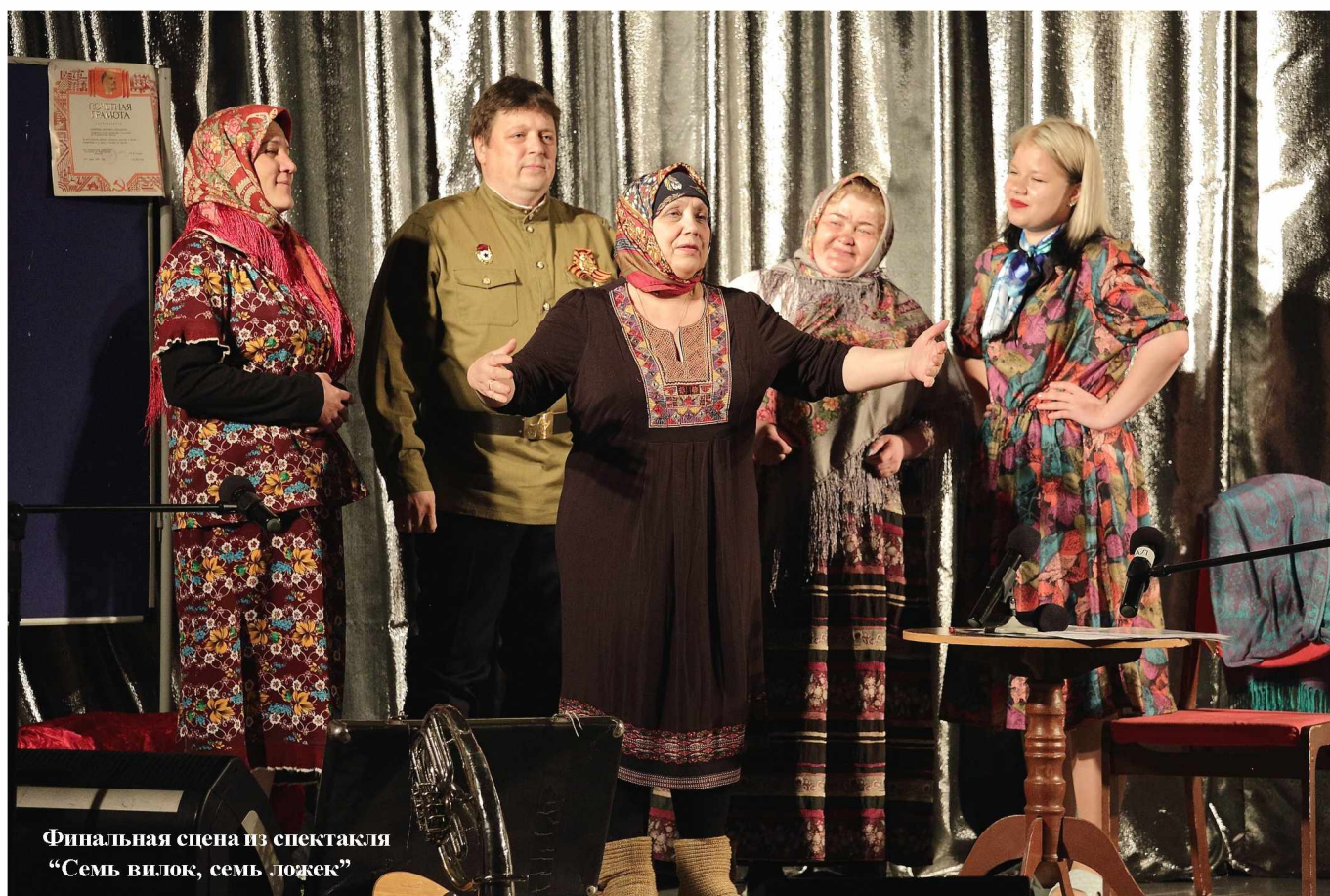
Финальная сцена из спектакля «Семь вилок, семь ложек»