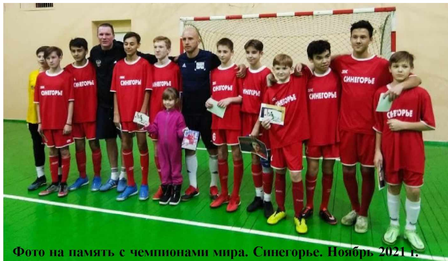
Фото на память с чемпионами мира. Синегорье. Ноябрь 2021 г.

18 ноября во Дворце спорта прошла товарищеская встреча по мини-футбо-