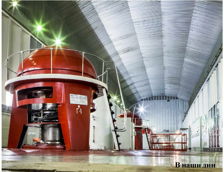
В наши дни

– Руководить коллективом, немалая часть которого – энергетики во втором, а то и третьем поколении, гораздо проще, чем любым другим. Ведь люди, которые работают на предприятии много лет, там, где раньше работали их родители, к предприятию прикипели душой и настолько нацелены на результат, что готовы выкладываться, а при необходимости – трудиться сутки напролет для того, чтобы ре-