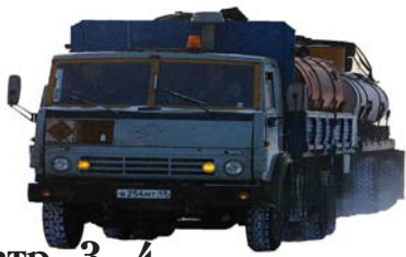
стр. 3, 4