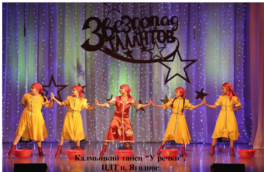
Калмыцкий танец “У реки”, ЦДТ п. Ягодное