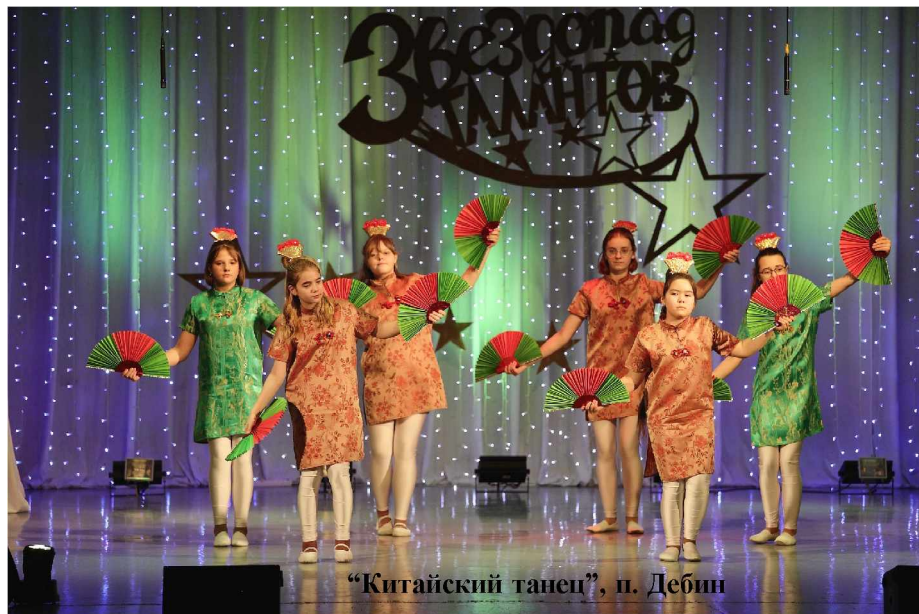
“Китайский танец”, п. Дебин

Наталья АНИСИМОВА.