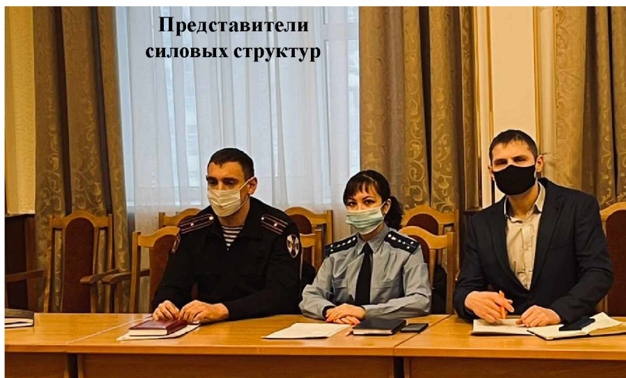
Представители силовых структур