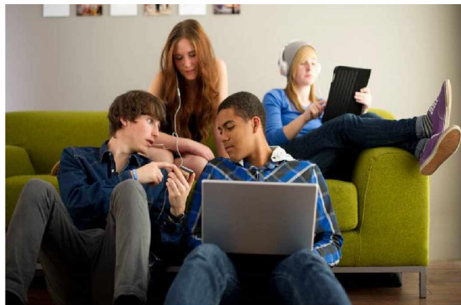
Подросткам общение заменили гаджеты