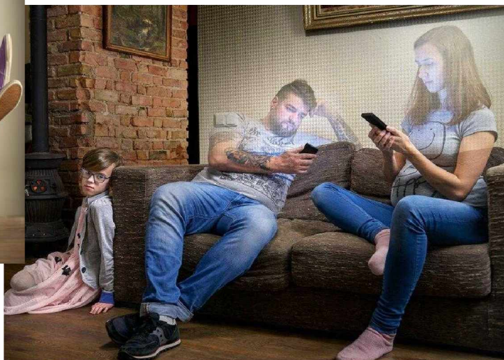
Общайтесь с ребенком, он скучает без вас