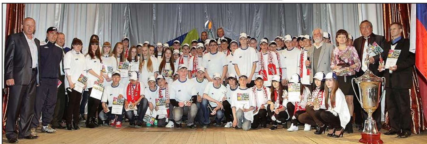
Команда Ягоднинского района - серебряный призер VI летней спартакиады учащихся Магаданской области.