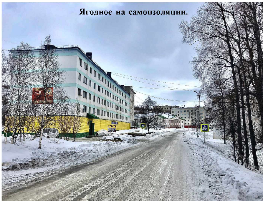
Ягодное на самоизоляции.

Берегите своё здоровье, здоровье ваших близких и детей!