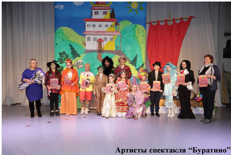
Артисты спектакля “Буратино”

В течение многих месяцев шла подготовка к этой премьере. Создавались костюмы, декорации, тщательно прорабатывался музыкальный материал. Постепенно день за днем на репетициях воплощались режиссерские задумки. Шла кропотливая и нелегкая творческая работа взрослых и детей. Этот интересный и позитивный процесс совместного творчества все участники будут