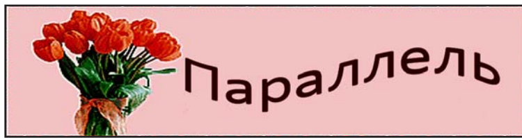
(Окончание. Начало на 6-й стр.)