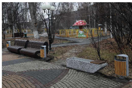
В парке Ягодного