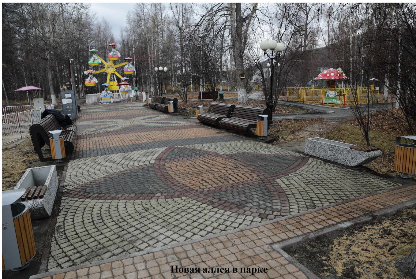
Новая аллея в парке