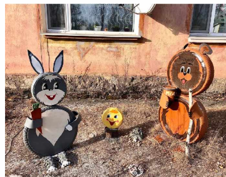
и игрушечный зоопарк по ул. Спортивная, 17