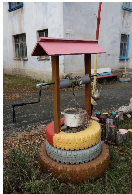
Колодец, колодец, дай воды напиться!