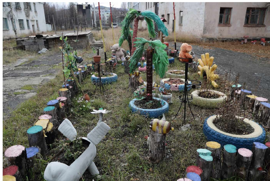
Веселая сказочная семейка у дома № 7 по ул. Школьная