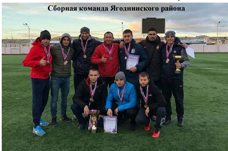
Сборная команда Ягоднинского района