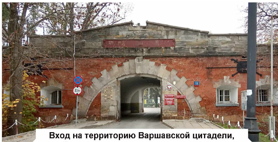
Вход на территорию Варшавской цитадели, где идёт строительство музея истории Польши, и фрагмент крепости. 25.10.2019 г.