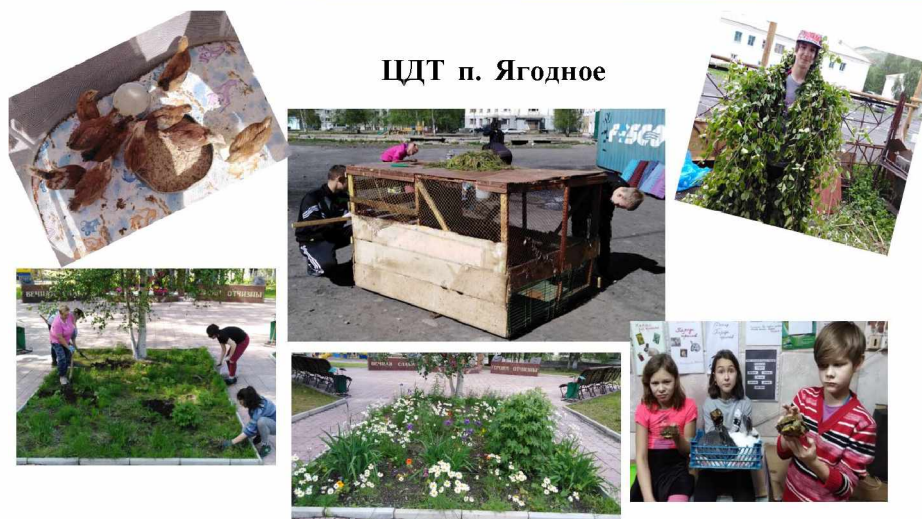
ЦДТ п. Ягодное