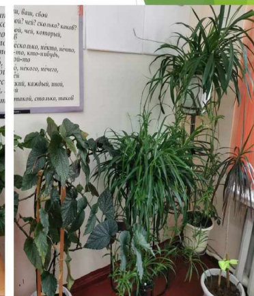
Фитомодули в кабинетах