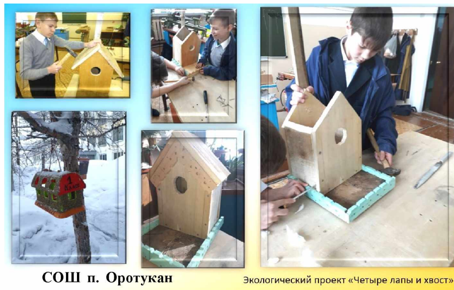
СОШ п. Оротукан

Комитет образования Ягоднинского городского округа.