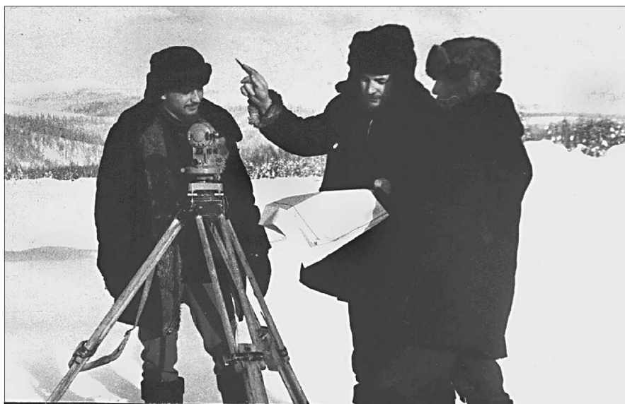
Геологи Болонойской геолого-разведочной партии Ягоднинской геолого-разведочной экспедиции занимаются разбивкой буровых линий. 1973 г. (Музей «Память Колымы», п. Ягодное, Магаданская обл. Архив Владимира Шпикермана, г. С.-Петербурга).

построения меня удивил. Забой выработки находился значительно ниже максимально возможного уровня днища разведваемой долины. Перебур составил не менее 15 метров. Это был хоть и обидный, но показательный урок. Обучение продолжалось, но аудитории и профессора уже были иные. Осваивать приходилось и новые местные термины. Попробую дать определение одному из них. «Синюга» – глинистая структурная кора выветривания сульфидизированных алевролитов и аргиллитов; нередко присутствует в плотике колымских россыпей золота и часто распространяется в коренных породах значительно ниже днища долины. Искать свободное золото в такой коре выветривания бессмысленно.