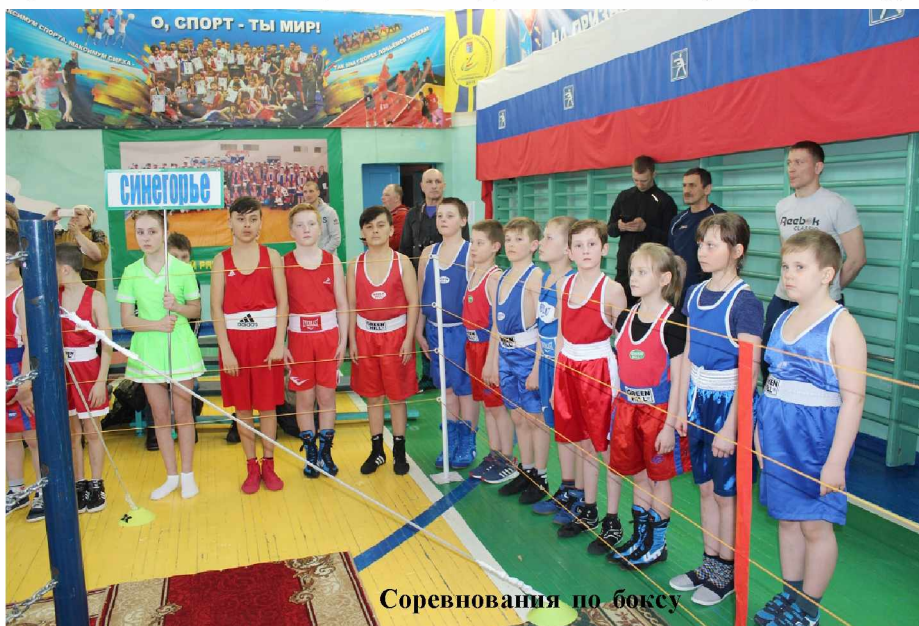
Соревнования по боксу