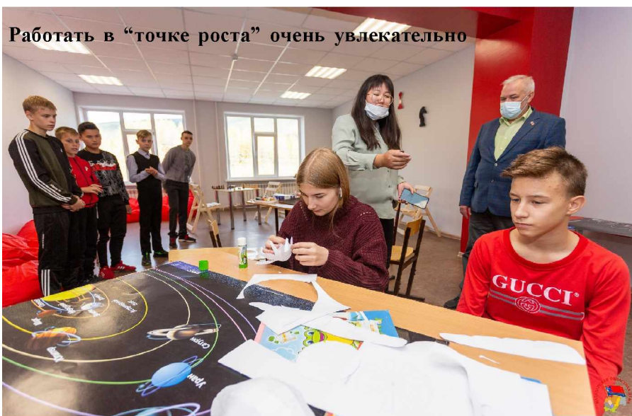
Работать в “точке роста” очень увлекательно