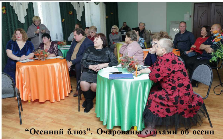
“Осенний блюз”. Очарованы стихами об осени