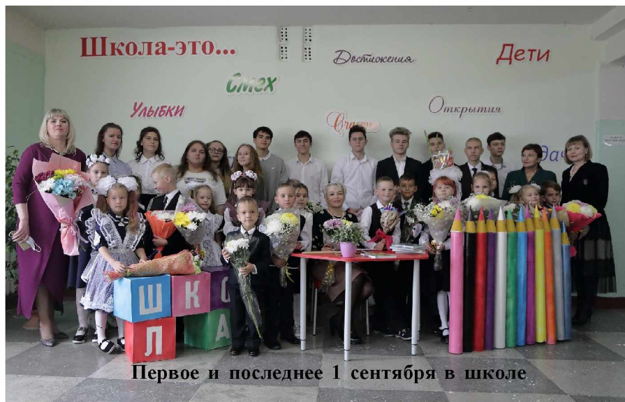
Первое и последнее 1 сентября в школе