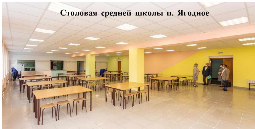
Столовая средней школы п. Ягодное

- Однозначно школам требуется больше новых устройств, которые облегчат работу поваров. Оротуканской школе крайне необходимы тестомесильная машина и прилавок-мармит, а также хотя бы косметический ремонт обеденного зала. Считаю, руководство образовательных учреждений и администрация окру-