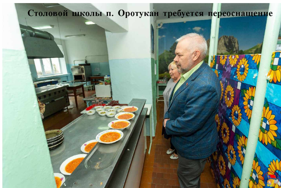
Столовой школы п. Оротукан требуется переоснащение