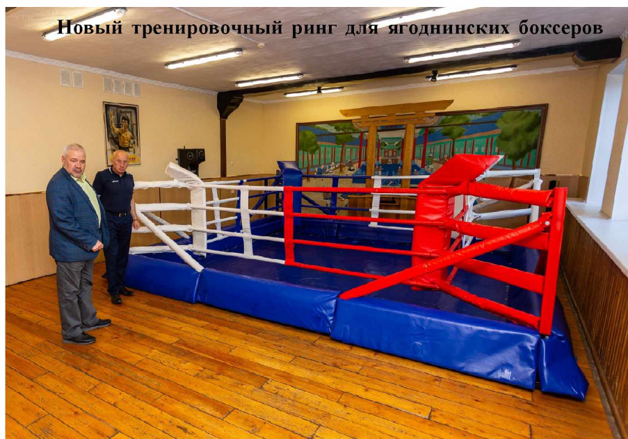
Новый тренировочный ринг для ягоднинских боксеров