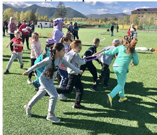
день веселья и смеха

УЧРЕДИТЕЛЬ - Администрация Ягоднинского городского округа. Газета «Северная правда» зарегистрирована Управлением Федеральной службы по надзору в сфере массовых коммуникаций, связи и охраны культурного наследия по Магаданской области и Чукотскому автономному округу. Регистрационный номер серия ПИ № ТУ 49-0002 от 20.08.2008