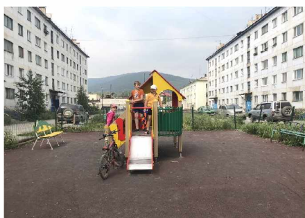
Во дворе на Транспортной, 12 и 15