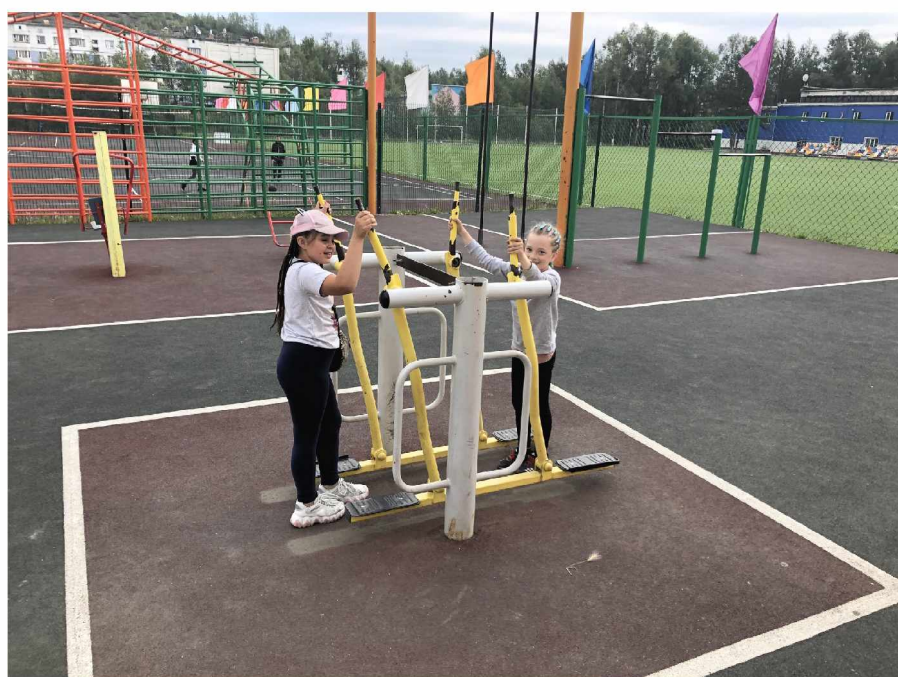
На спортивной площадке