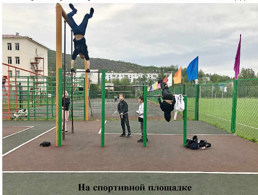
На спортивной площадке