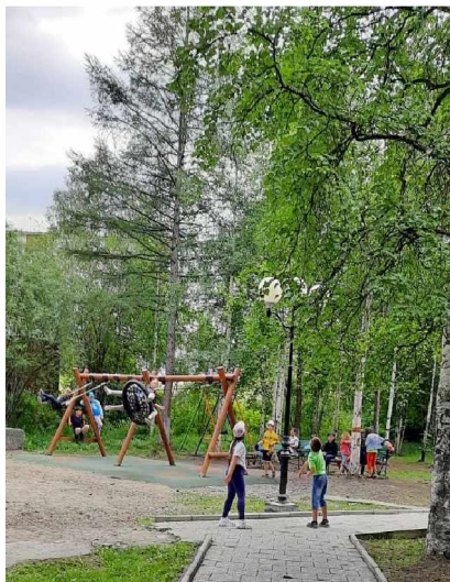
На качелях в парке