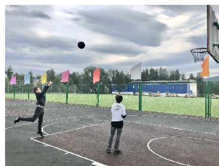
На волейбольной площадке