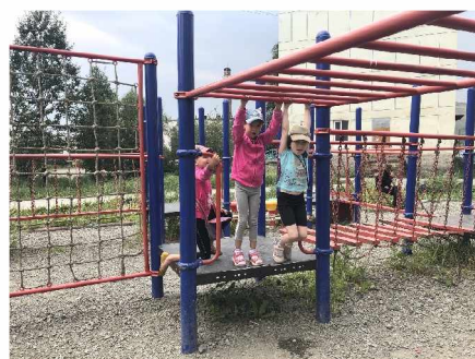
Во дворе на Транспортной, 10