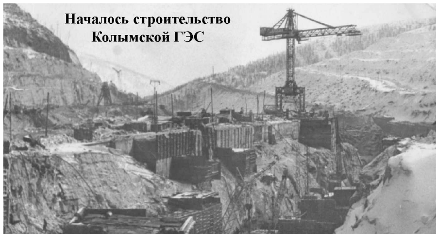
Началось строительство Колымской ГЭС

Специалисты, которые работали на ГЭС в то время имели опыт возведения гидроэлектростанций в условиях вечной мерзлоты. Но уникальная конструкция столь мощной ГЭС – с подземным рас-