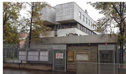
Вход в Культурный Центр при Посольстве Польши. 16.10.2019 г.

Минут через десять меня пригласили к окошку расписаться в нескольких бумагах. А потом начали снимать отпечатки пальцев. И тут возникла очередная проблема, которой я уже не радовался – сколько можно? Пальцы правой руки отпечатались нормально, а вот левой почему-то не получались. Раз десять по совету сотрудника посольства я прикладывал пальцы к устройству, давил, что есть силы, но увы. Извинившись, сотрудник отлучился и минуты через три пришёл с двумя симпатичными девушками, которые, увидев меня, заулыбались и заявили: «А мы вас знаем!» У меня аж мороз по коже пробежал. Спрашиваю испуган-