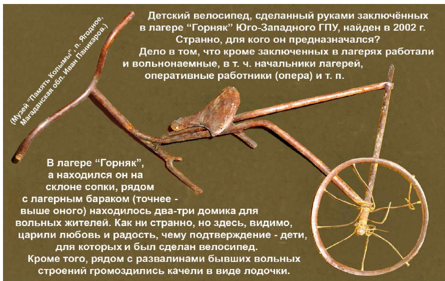
(Музей «Память Колымы», г. Ягодное, Магаданская обл., Иван Паникаров.)

Детский велосипед, сделанный руками заключённых в лагере «Горняк» Юго-Западного ГПУ, найден в 2002 г. Странно, для кого он предназначался?