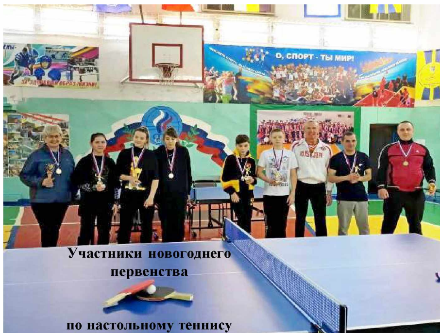
Участники новогоднего первенства по настольному теннису

Любимые спортивные игры «Дед Мороз», «Белые медведи», «Тигр идёт»