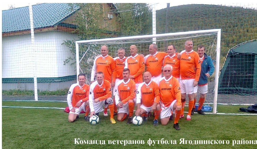
Команда ветеранов футбола Ягоднинского района

По итогам сыгранных матчей определились 2 лидера, выигравших по 2 игры у соперников, которые и встретились в финале за звание чемпионов, это команды «Кривбасс» и «Галеон» (прошлогодние победители турнира). Матч получился очень напряженным, до конца второго периода болельщики не могли определить, кто же сегодня увезет с собой Кубок победителя. В первом периоде футболисты «Галеона» вывели свою команду вперед и сохранили преимуще-