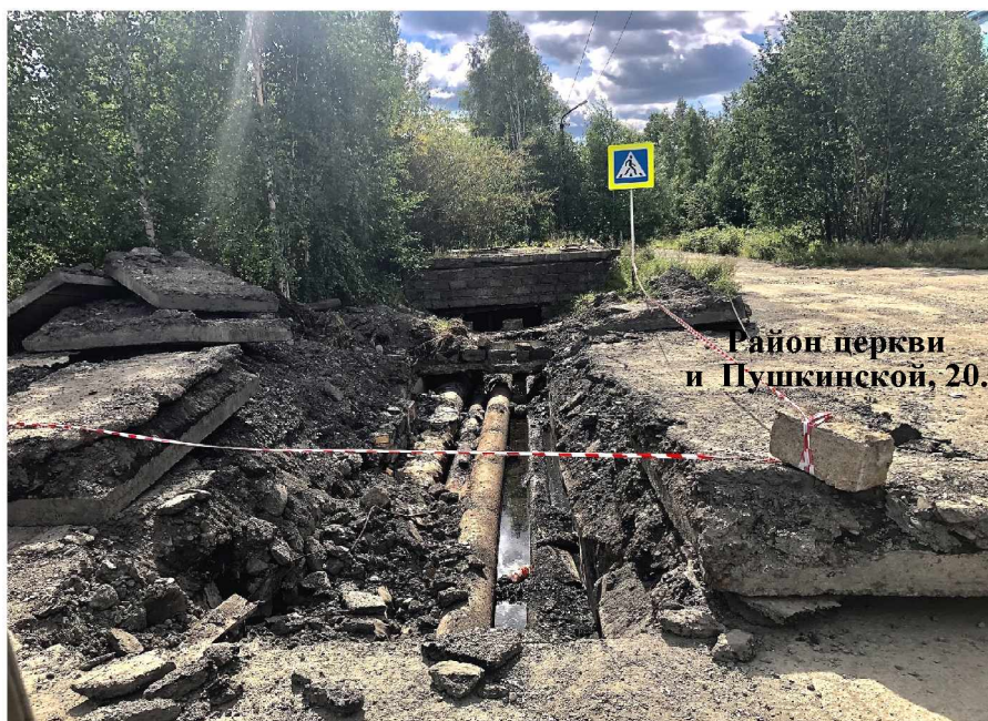
Район церкви и Пушкинской, 20.

Говоря о подготовке к зиме, традиционно имеют в виду не только тепло, но и подготовку электрических сетей. С ноября прошлого года электросети полностью отопили к магаданским «Региональным энергетическим системам». Работники этого предприятия привели в порядок ФИДЕРЫ №№ 1 и 7, от которых запитываются котельная и водозабор, поме-