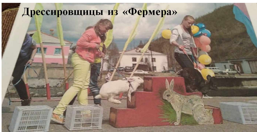
Дрессировщицы из «Фермера»