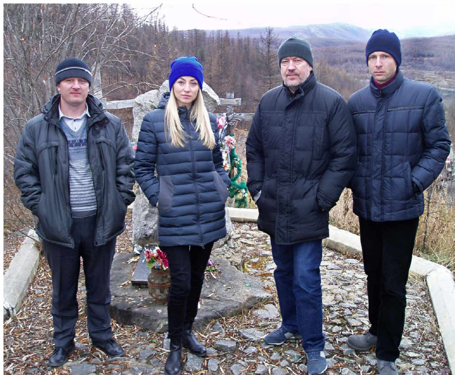
На «Серпантинке». 24.09.2019 г.