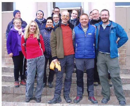
Польские туристы на ступеньках Дома культуры в посёлке Ягодное Магаданской обл. 23.09.2019 г.

Решили посетить «Колымскую Атлантиду» – филиал музея «Память Колымы», находящийся в поселковом Доме культуры. О лагерях гости многое знают, в т. ч. и неправды. Внимательно слушали мой краткий рассказ о Колыме после лагерной. Задавали вопросы и по лагерной теме. Восхищались экспонатами – вещами 1950-1980-х годов: мебелью, посудой, одеждой и обувью, фотоаппаратами, телефонами, теле-радио-аппаратурой, часами, старыми газетами, кар-