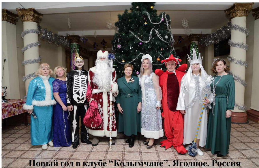
Новый год в клубе “Колымчане”. Ягодное. Россия

да луна завершает свой полный цикл, и наступает новолуние. Торжества здесь продолжаются 15 дней и заканчиваются Праздником фонарей. В мероприятиях участвуют и взрослые, и дети. На улицах рябит в глазах от ярких праздничных одежд, ярмарочных товаров и огней. Вечером люди собираются в тесном семейном кругу на ужин, где дарят друг другу часто не подарки, а красные конвертики с деньгами. Когда стемнеет, люди выходят на улицы, чтобы запускать салюты, праздничные фейерверки, жечь благовония. Китайцы верят в древнюю легенду о страшном чудовище Нянь, которое приходило под Новый год, чтобы съесть у людей весь скот, припасы и зерно, а иногда и детей. Однажды люди увидели, как Нянь испугался ребенка, одетого в красную одежду. С тех пор они стали под Новый год развешивать возле своих жилищ красные фонарики и свитки, чтобы отпугнуть зверя. Праздничные фейерверки и благовония также считаются хорошими отпугивателями этого чудовища.