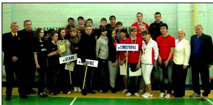
Команды Ягоднинского района (настольный теннис).

В минувшую субботу, 26 января, в 11:30 в МБОУ «СОШ п. Оротукан» была открыта VIII районная спартакиада учащихся образовательных учреждений Ягоднинского района, начались соревнования по настольному теннису среди юношей и девушек 1996 - 1998 годов рождения. Для детей в школе было организовано 2-разовое горячее питание, спортивный зал подготовлен для соревнований и празднично украшен.