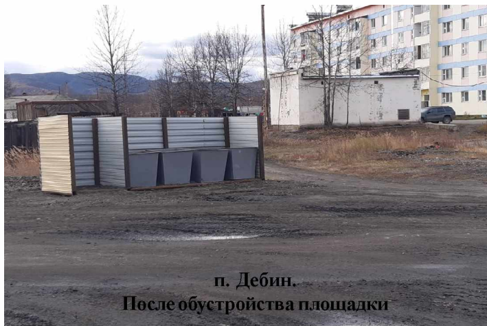
п. Дебин. После обустройства площадки