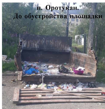
п. Оротукан. До обустройства площадки