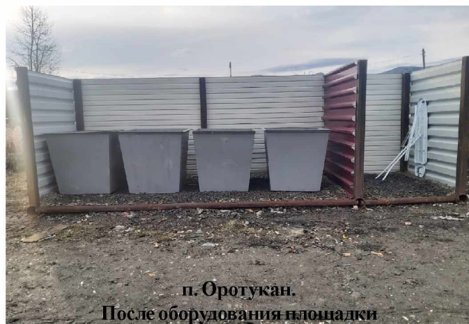
п. Оротукан. После оборудования площадки