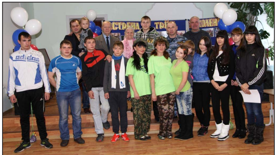
Страницу подготовила Валерия КАДЫШЕВА.

У каждого пришедшего на эту встречу была возможность поделиться собственными историями, связанными с призывом в армию и прохождением военной службы, поздравить новобранцев. Ведущие ме-