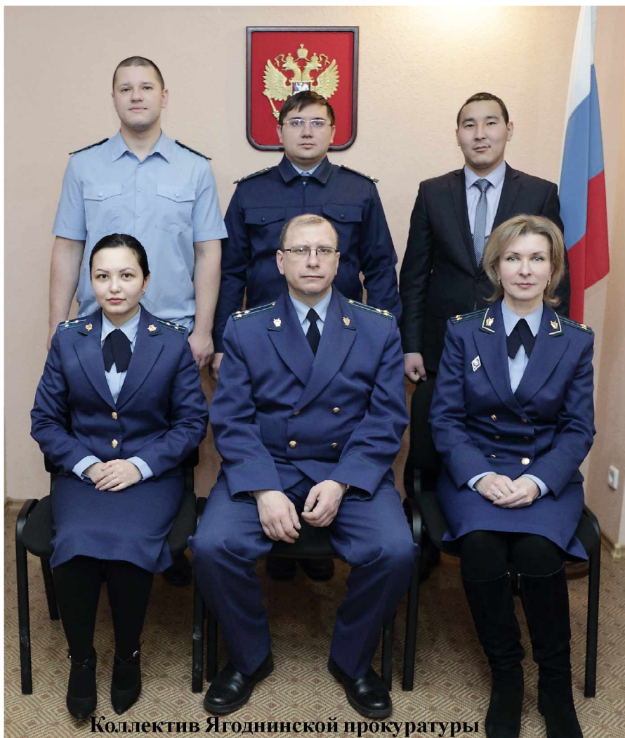
Коллектив Ягоднинской прокуратуры

- Хочу отметить, что благодаря профилактической работе правоохранительных органов и других заинтересо-