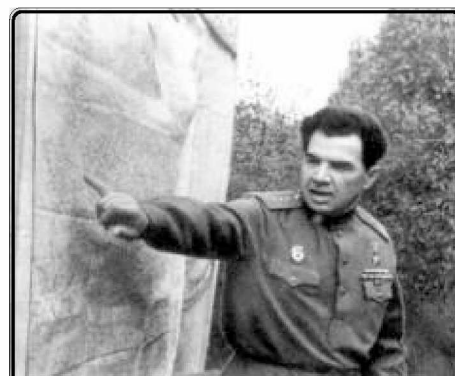
Командующий армией Чуйков перед офицерами и солдатами накануне форсирования реки Висла.

Маршал Советского Союза, дважды Герой Советского Союза - Василий Иванович был награжден многими ор-