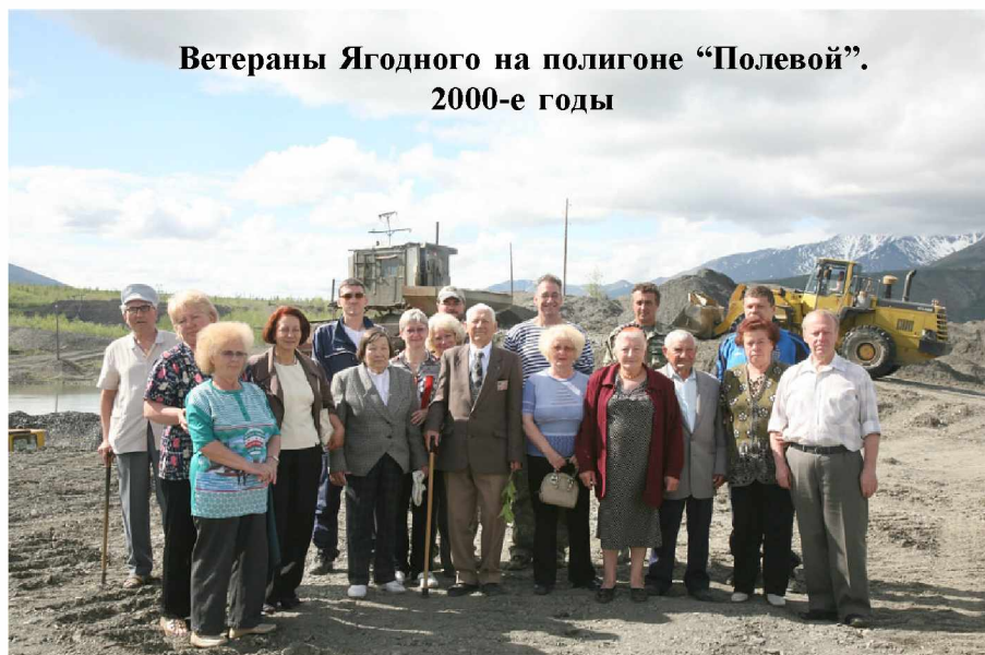
Ветераны Ягодного на полигоне “Полевой”. 2000-е годы