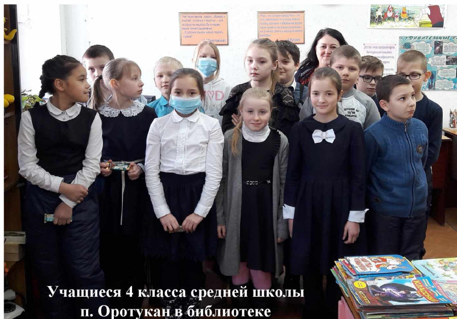
Учащиеся 4 класса средней школы п. Оротукан в библиотеке