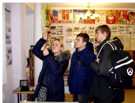
Ягодное. “Колымская Атлантида”