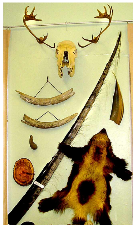
Музей школы в п. Дебин. 2020 г. Шкура россомахи, китовый ус, череп и рога оленя, часть бивня мамонта.

К половине 12-го подъехали к Дебинской средней школе, где должны посетить