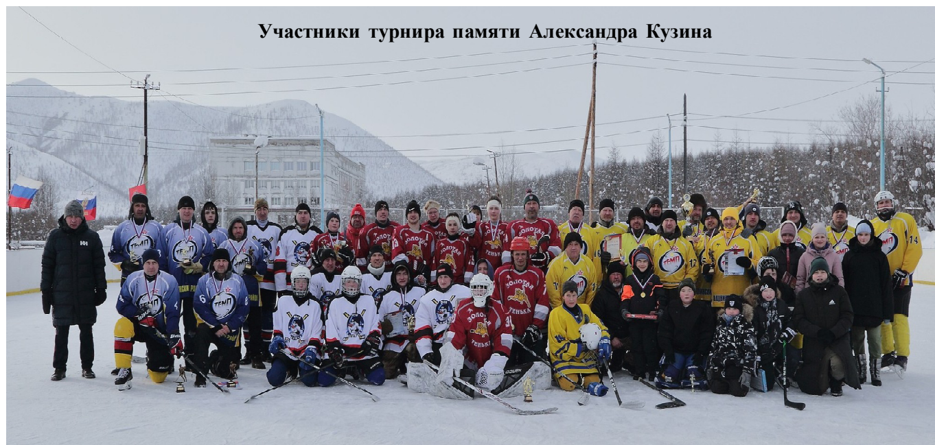
Участники турнира памяти Александра Кузина