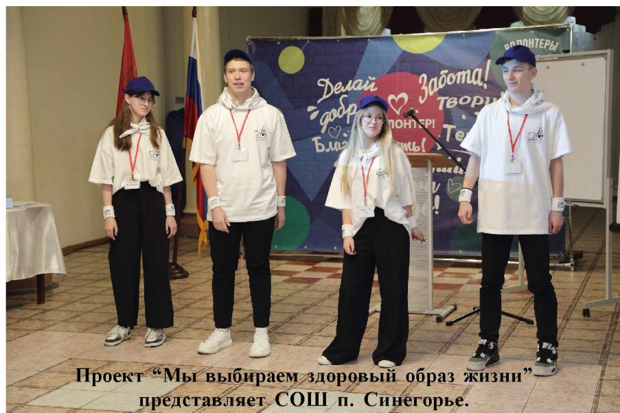
Проект “Мы выбираем здоровый образ жизни” представляет СОШ п. Синегорье.

«Танцуй ради жизни» - так называется проект команды Центра детского творчества п. Ягодное. Ребята, изучая проблему увеличения количества факторов, влияющих на снижение здоровья детей, пришли к выводу, что в век цифровых технологий процесс обучения в школе без использования компьютера практически невозможен.