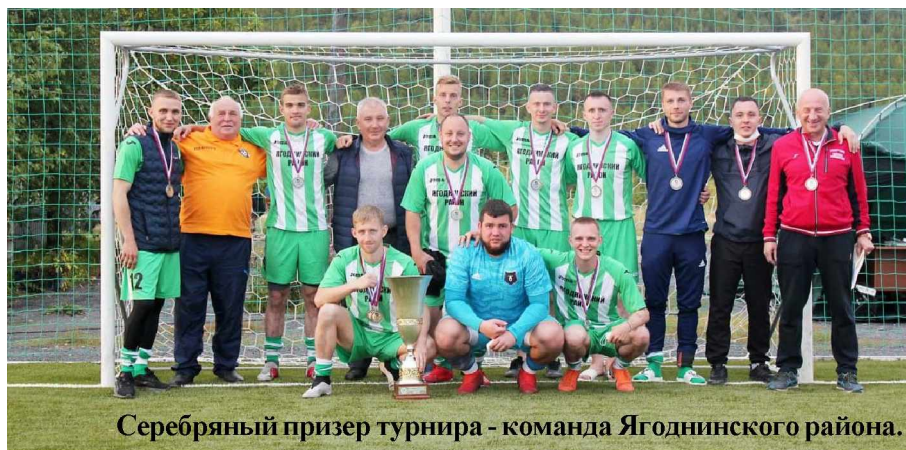
Серебряный призер турнира - команда Ягоднинского района.

Главный приз и право быть победителями оспорили фавориты турнира – команды «Кривбасс» и Ягоднинского района. С первой до последней минуты игра держала болельщиков в напряжении. В первом тайме команда Ягодного забила мяч в ворота