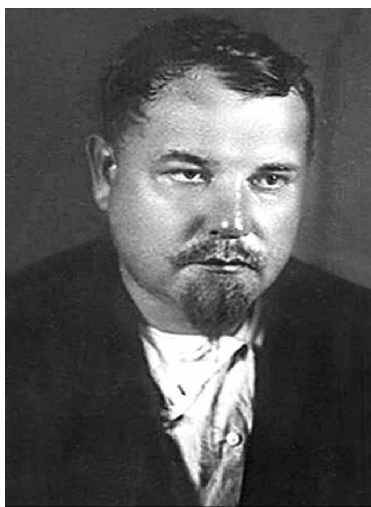
Медведь Филипп Демьянович, начальник ЮГПУ ДС (Южное горно-про- мышленное управление Дальстроя) 1930-е гг.

Медведь Филипп Демьянович, род. в 1890 г. в дер. Мосево (Белоруссия). Член РСДРП(б) с 1907 г. С 1909 г. четырежды арестовывался царской охранкой. В октябре 1917 г. участвовал в подготовке вооруженного восстания в Москве, входил в состав военно-революционного комитета Сокольнического района. С 1918 г. – член Контрольной комиссии ВЧК, председатель Тульской и Петроградской ЧК, начальник особого отдела Западного фронта, член коллегии ВЧК, заместитель председателя Московской ЧК, начальник Московского губернского отдела ГПУ, полномочный представитель ВЧК по Западному краю.