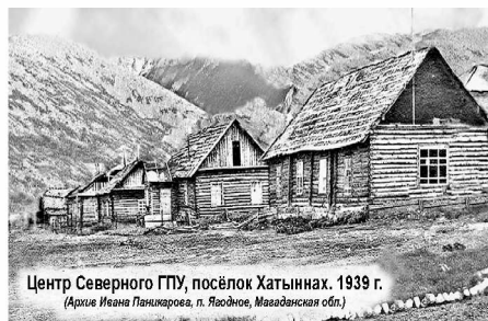
Центр Северного ГПУ, посёлок Хатыннах. 1939 г.